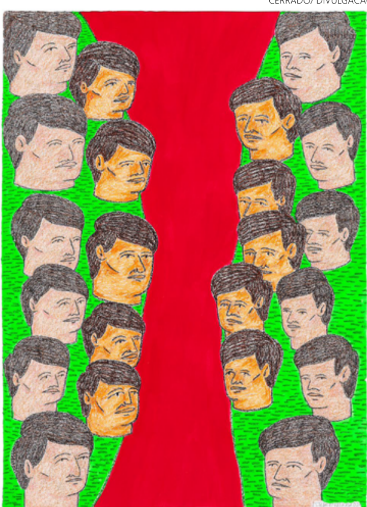
Obra criada pelo artista visual Estêvão Parreiras

"Enquanto galeria recém-inaugurada, é importante estar no cenário nacional da arte contemporânea, assim como levar a produção artística do Centro-Oeste de maneira qualificada para ser vista por