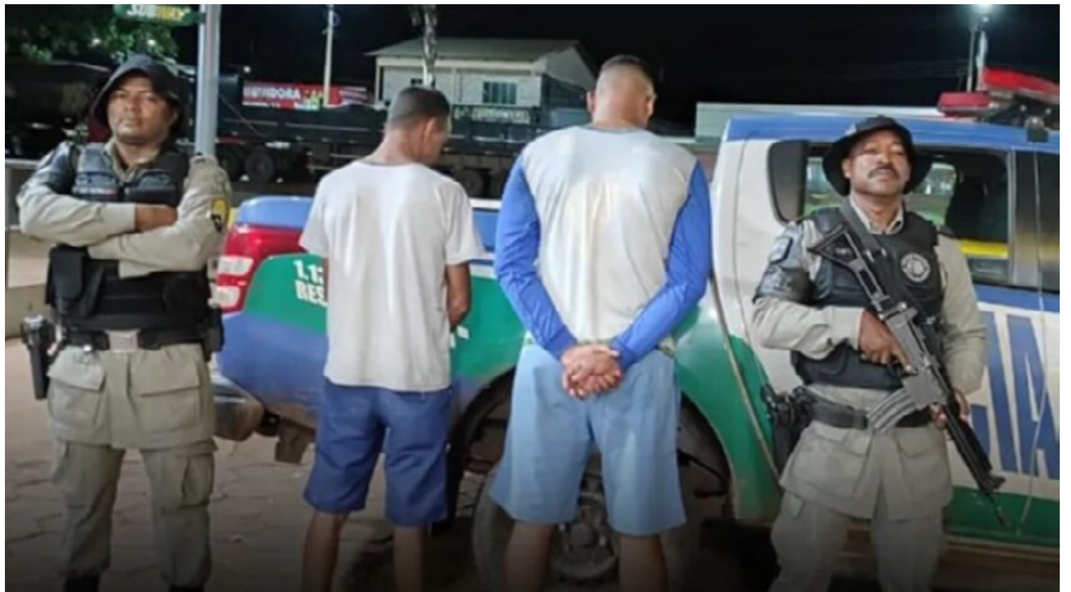
A prisão da dupla foi resultado de denúncias recorrentes de caça e pesca predatória na região rural do município

A prisão da dupla foi resultado de denúncias recorrentes de caça e pesca predatória na região rural do município. Em resposta a essas denúncias, a equipe do Batalhão Rural intensificou o patrulhamento às margens da Barragem do Assentamento Santa Maria, onde os