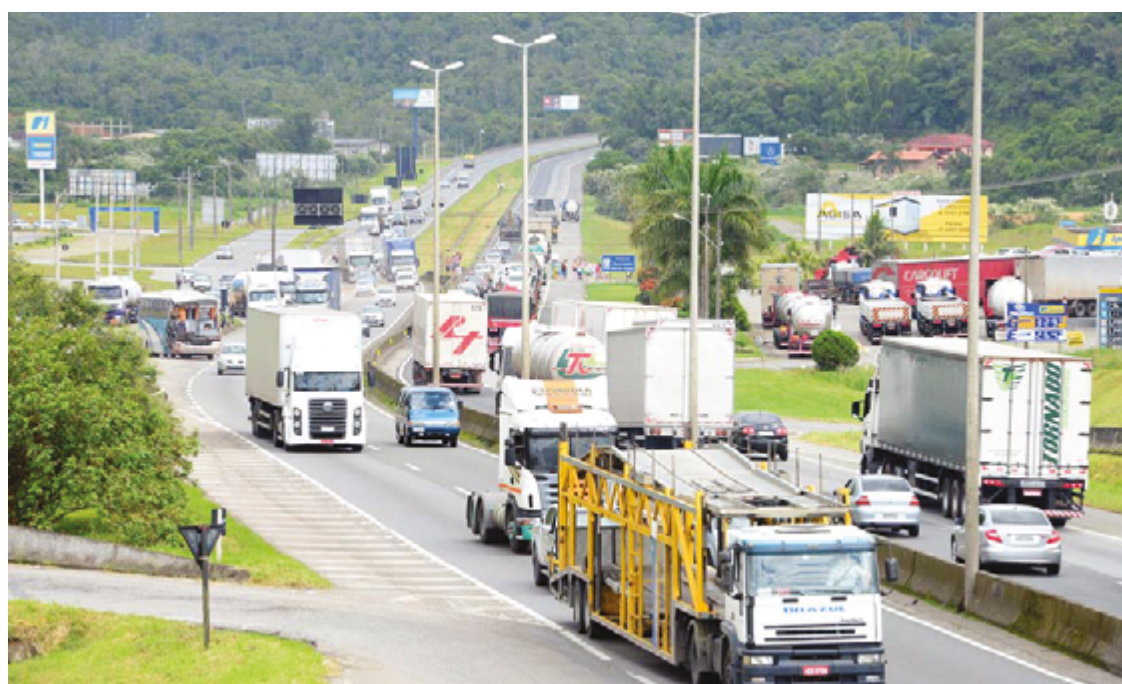
Segundo a concessionária, rodovias 153, 414 e 080, no feriado da Páscoa, receberam 209.982 veículos

Levantamento é da Ecovias do Araguaia e acréscimo se refere à comparação com o mesmo período no ano passado