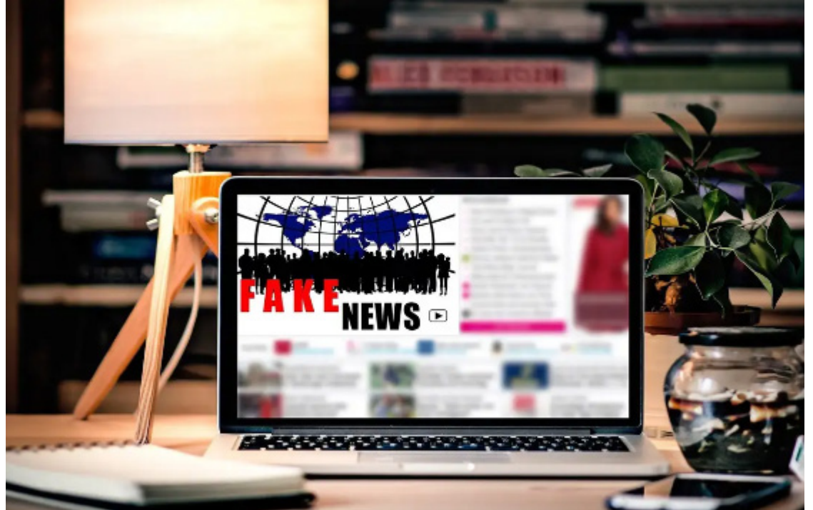
Na pesquisa, 62% afirmaram confiar na própria capacidade de diferenciar informações falsas e verdadeiras em um conteúdo

(24%) afirma já ter sido acusado de espalhar informações falsas por pessoas que têm uma visão de mundo diferente.