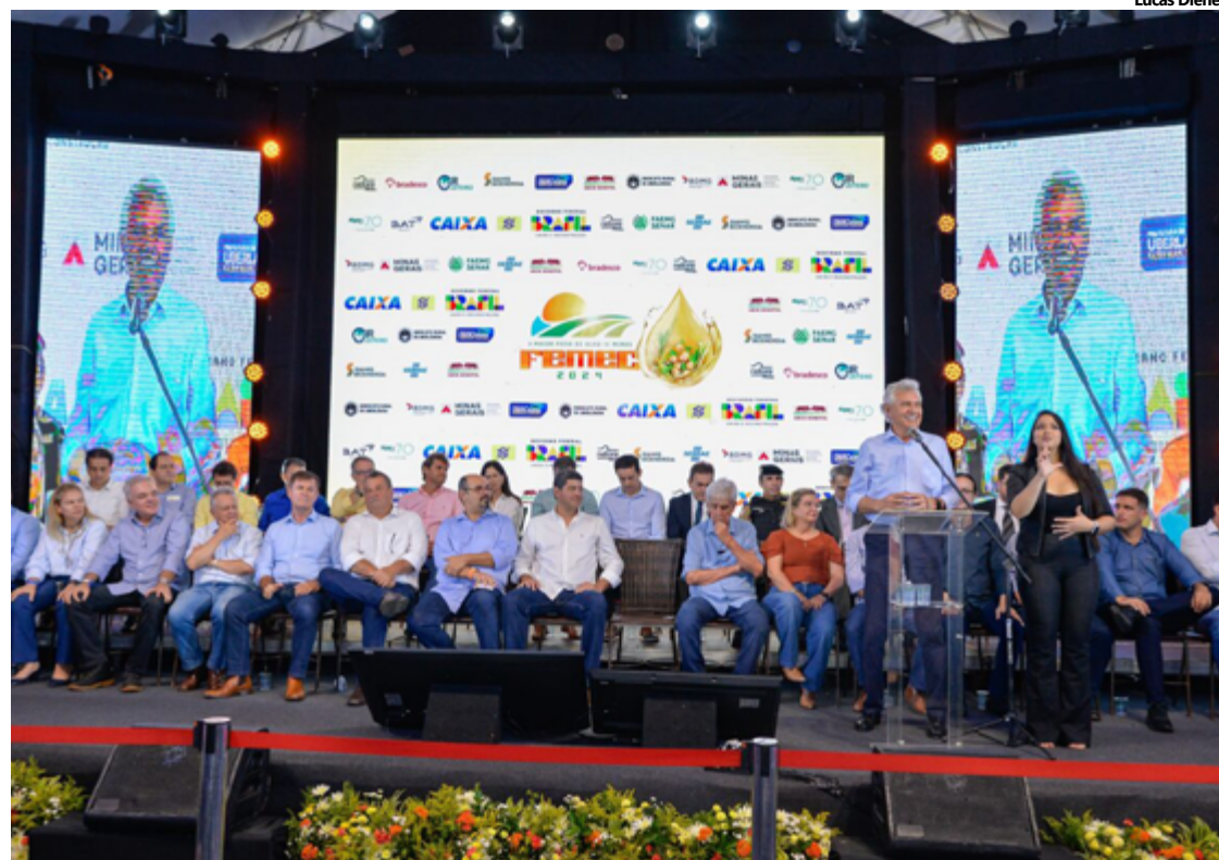
Caiado é convidado para feira agrícola em Uberlândia (MG): reconhecimento pela atuação em apoio à atividade rural

ocorre no Parque de Exposições Camaru e segue até o próximo sábado (05), com participação de empresários e entidades de classe. O prefeito de Uberlândia, Odelmo Leão,