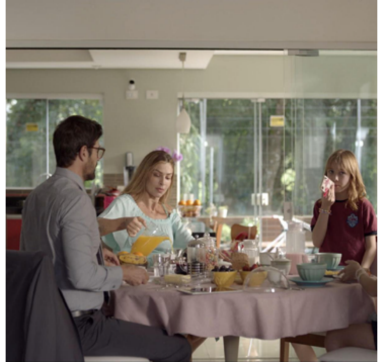
Grazi Massafera (ao centro) afirma que mulheres já se questionaram se estão enlouquecendo