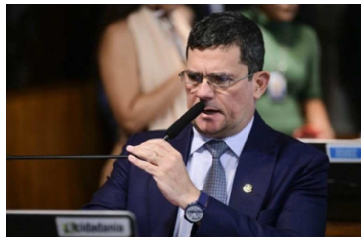
Sergio Moro: acusado de abuso do poder econômico